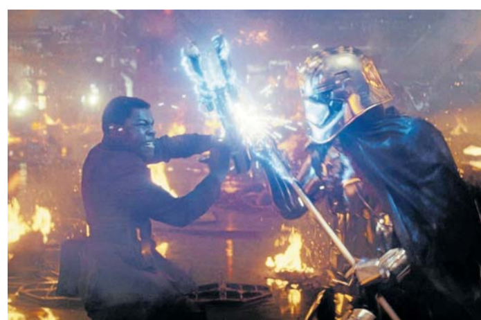
Der mit Spannung erwartete Film „Star Wars – Die letzten Jedi“ entstand unter Mitwirkung Gutschmidts.

Er kommt unter bei Industrial Light & Magic, der Haus- und Hofschmiede für Effekte von Lucasfilm – mittlerweile an den Disney-Konzern verkaufter Medienkonzern von Star Wars-Schöpfer George Lucas. Gutschmidt arbeitet über die Jahre in verschiedenen Funktionen an Filmprojekten, die auch dank seines Mitwirkens überwiegend zu großen Erfolgen an der Kinokasse werden. Mit Casper (1995) fängt alles an, es folgen Arbeiten wie Men in Black (1997), Harry Potter und der Stein der Weisen